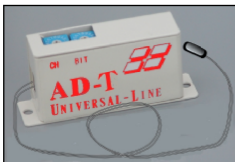
図3 温度計測用伝送温度計

省エネ管理データの基本となる流量センサよりのパルスや電力のパルス信号の計測は図2のようなマッチ箱大の大きさの[伝送カウンタ(AD3)]を使用することで可能になる。2本の伝送ラインを自由にパラレル分岐してその先に伝送カウンタ経由で流量計等のパルス信号を接続すれば最大 250台までの流量、電力量等の個別計測が可能になる。2本線の時分割方式で集めたデータは RS232C変換器経由でパソコンに取込むことができる。またこの計測用に各種のソフトがあり最大250台の時間ごとのエネルギー使用データがCSVファイルで保存される。通信フォーマットは公表しているので独自にシーケンサやパソコンに取込んでいる場合もある。