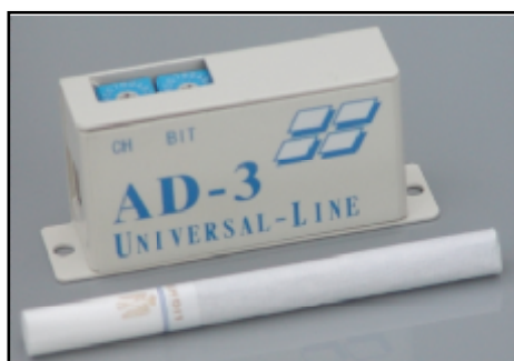
図2 パルス積算用伝送カウンタ