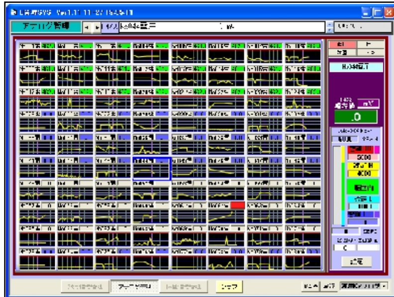
図4 80点マルチグラフ画面